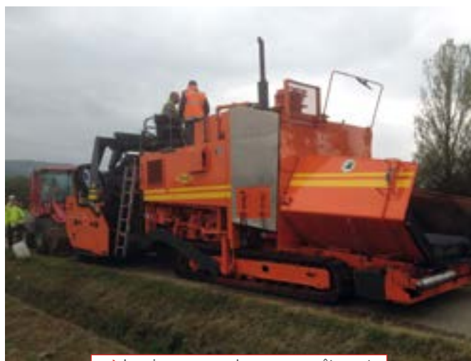
→ La mise en œuvre du nouveau revêtement

en œuvre avec un dispositif spécial, développé et fabriqué en France. Ces travaux ont été réalisés courant octobre par l'entreprise Colas. Celle-ci figure parmi les 9 lauréats soutenus par l'Etat qui veut favoriser l'émergence de solutions techniques nouvelles, durables et plus économiques.