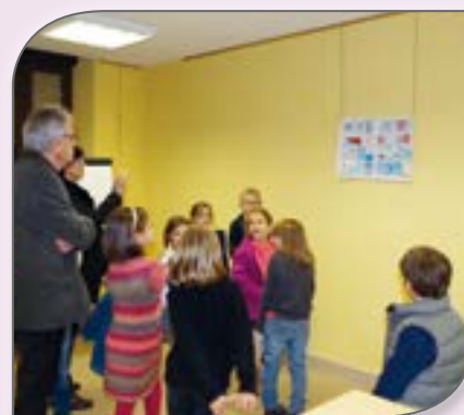
La Commission Animation de BousSENS

A bientôt pour de nouvelles aventures !!!!!!!!!!!!!!!