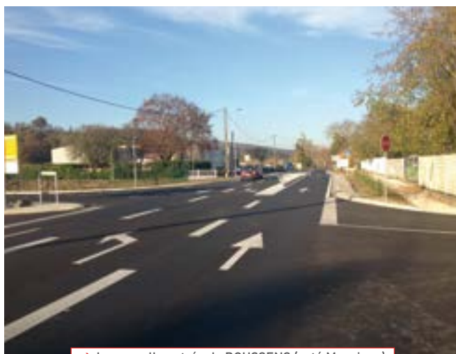
→ La nouvelle entrée de BOUSSENS (coté Mancieux)