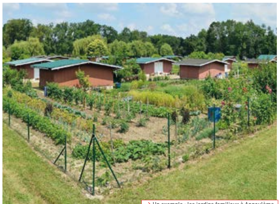
→ Un exemple : les jardins familiaux à Angoulême

Si cette proposition vous séduit, merci d'en faire part au secrétariat. Bien évidemment, il faudrait que plusieurs familles soient volontaires pour que la Mairie mette en œuvre cette proposition.